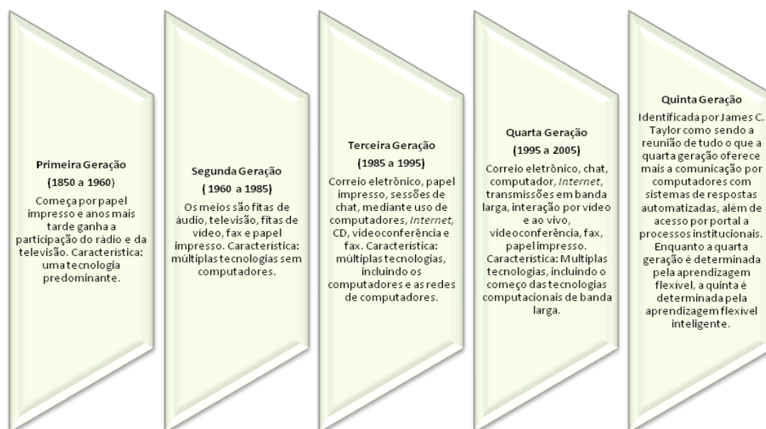
Figura 1 – As gerações de EAD.

para EaD. Sartori (2006) e Martins (2007) propõem quatro fases para o ensino a distância. Já Campos, Costa e Santos (2007), Santos (2007), Moore e Kearsley (2007) e Formiga (2012) delineiam cinco fases para a EaD. O diálogo entre os autores, tomando como base os respectivos referenciais temporais da EaD, indica que as fases iniciais são comuns na concepção dos mesmos, evidenciando numa sequência cronológica a utilização da mídia impressa via correspondência e o rádio, a utilização da TV e fitas de áudio e videocassete e os computadores que possibilitaram através da Internet o correio eletrônico e a videoconferência. As fases finais, especialmente, a quarta, se destacaram pela valorização do uso dos recursos computacionais e pela chegada da banda larga. Para alguns autores essa é a última fase na cronologia. A quinta fase, intimamente ligada a quarta, enfatiza uma forma mais flexível e inteligente de comunicação em rede. Na Figura 1 são identificadas cinco gerações da educação a distância.