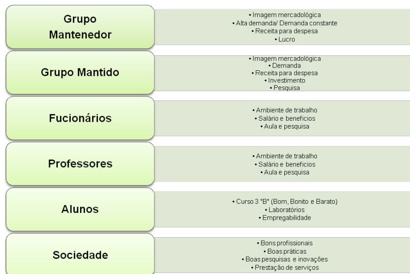
Figura 2 - Expectativa dos segmentos envolvidos na oferta de cursos ou disciplinas semipresenciais numa instituição de ensino.